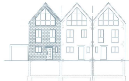
Straßenansicht (Vordächer als SW)