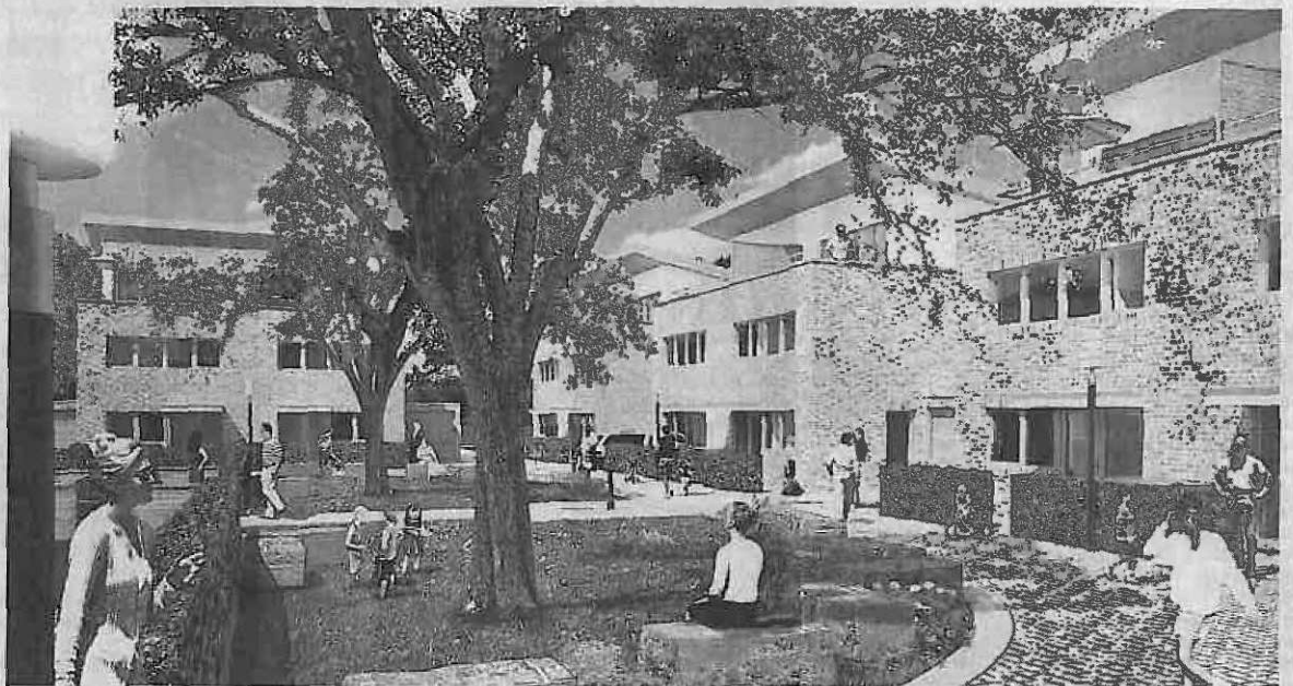
Henskes Hof in Pesch: So soll der Innenhof der geplanten Wohnanlage nach den Vorstellungen des Architekten Holger Hartmann aussehen. In weiten Teilen sind die Keller schon erstellt. Die Vermarktung der Anlage mit zunächst 17 Einfamilienhäusern ist angelaufen. Das Motto lautet: „Leben in der Idylle, arbeiten in der Stadt“.

In fünf Bauabschnitten wollen sie gemeinsam das 32 000 Quadratmeter große Areal an der Peripherie Peschs erschließen. Zunächst wird Henskes Hof als ausgediente Industriebrache auf 7500 Quadratmetern erschlossen: 17 Einfamilienhäuser